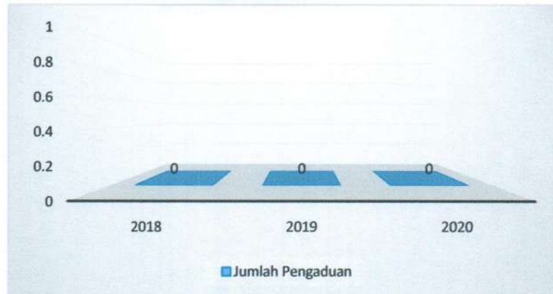
Grafik 3.4 Data Pengaduan pada Pengadilan Negeri Marisa

Berdasarkan grafik di atas, diketahui bahwa selama kurun waktu Tahun 2018, 2019 dan 2020, tidak ada laporan pengaduan di Pengadilan Negeri Marisa. Hal ini mengindikasikan semakin meningkatnya kualitas pelayanan, kinerja serta integritas para Pegawai Pengadilan Negeri Marisa. Analisis pencapaian targetnya adalah NIHIL. Capaian indikator Persentase pengaduan yang ditindaklanjuti adalah sebagai berikut: