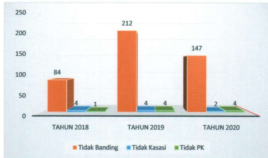
Grafik 3.2 Perbandingan perkara yang tidak mengajukan upaya hukum Banding, Kasasi dan PK Tahun 2018, 2019 dan 2020

Perbandingan jumlah Perkara yang tidak mengajukan upaya hukum Banding, Kasasi dan Peninjauan Kembali (PK) di Pengadilan Negeri Marisa pada Tahun 2018, 2019 dan 2020 dapat dilihat pada grafik berikut ini :