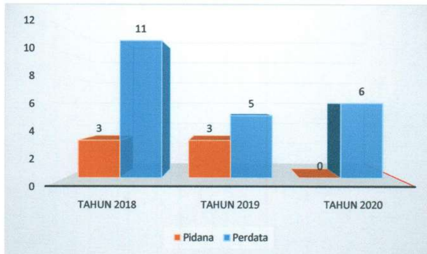
Grafik 3.1 Perbandingan Sisa Perkara Perdata dan Pidana Tahun 2018, 2019 dan 2020

Faktor yang mempengaruhi Keberhasilan Pengadilan Negeri Marisa dalam pencapaian target penurunan sisa perkara pidana pada tahun 2020 diantaranya adalah pelaksanaan tugas-tugas kepaniteraan Pidana yang sudah sesuai dengan SOP, Adanya fungsi Pengawasan melekat dari pimpinan, Komitmen bersama antara Panitera beserta jajarannya dalam pelaksanaan tugas-tugas di kepaniteraan serta komitmen dalam implementasi Sistem Informasi Penelusuran Perkara (SIPP) serta Pelaksanaan Monitoring dan Implementasi SIPP yang baik dari Pimpinan Pengadilan Negeri Marisa.