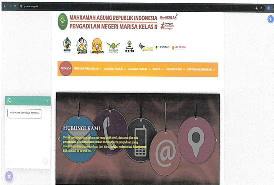
Website Pengadilan Negeri Marisa dengan inovasi “Maleo”