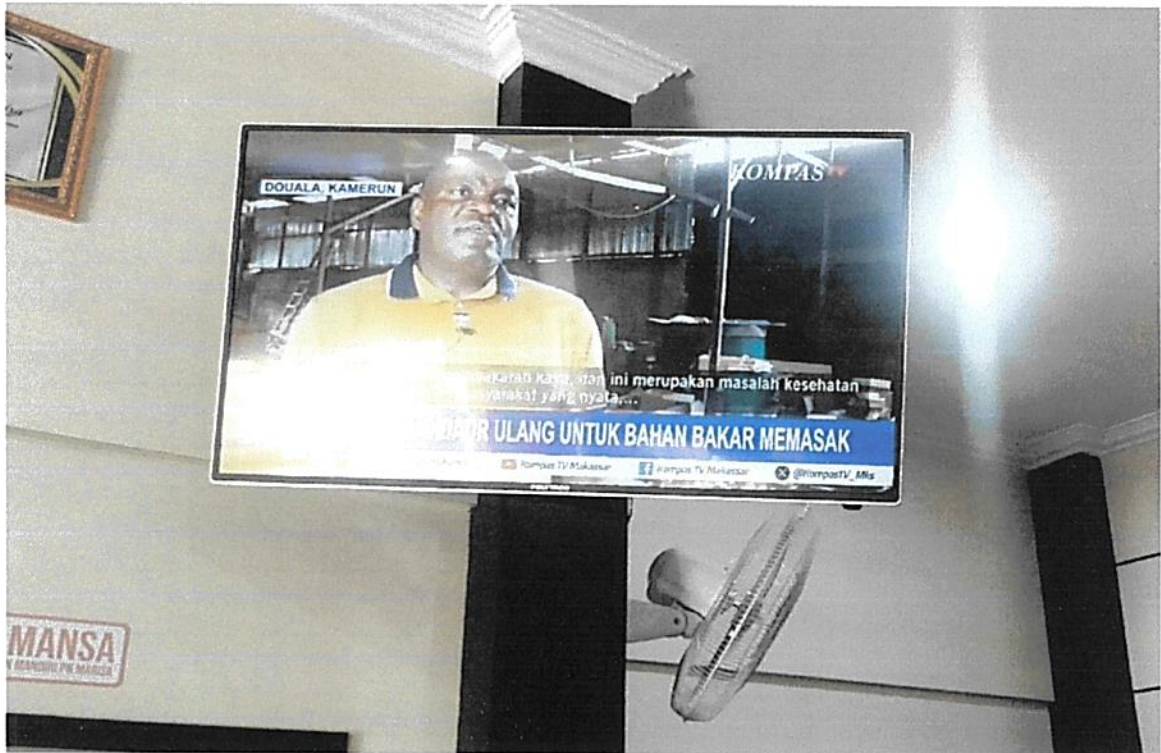
Monitor siaran TV Nasional