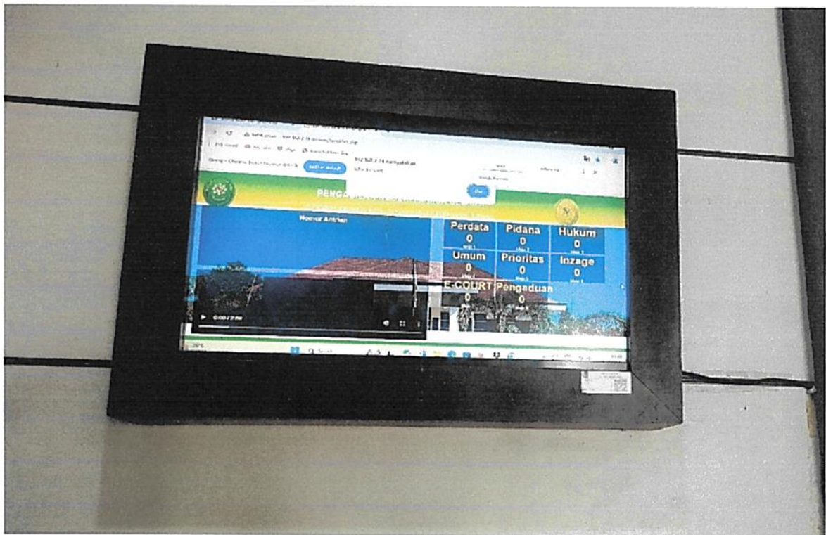
Monitor display antrian PTSP