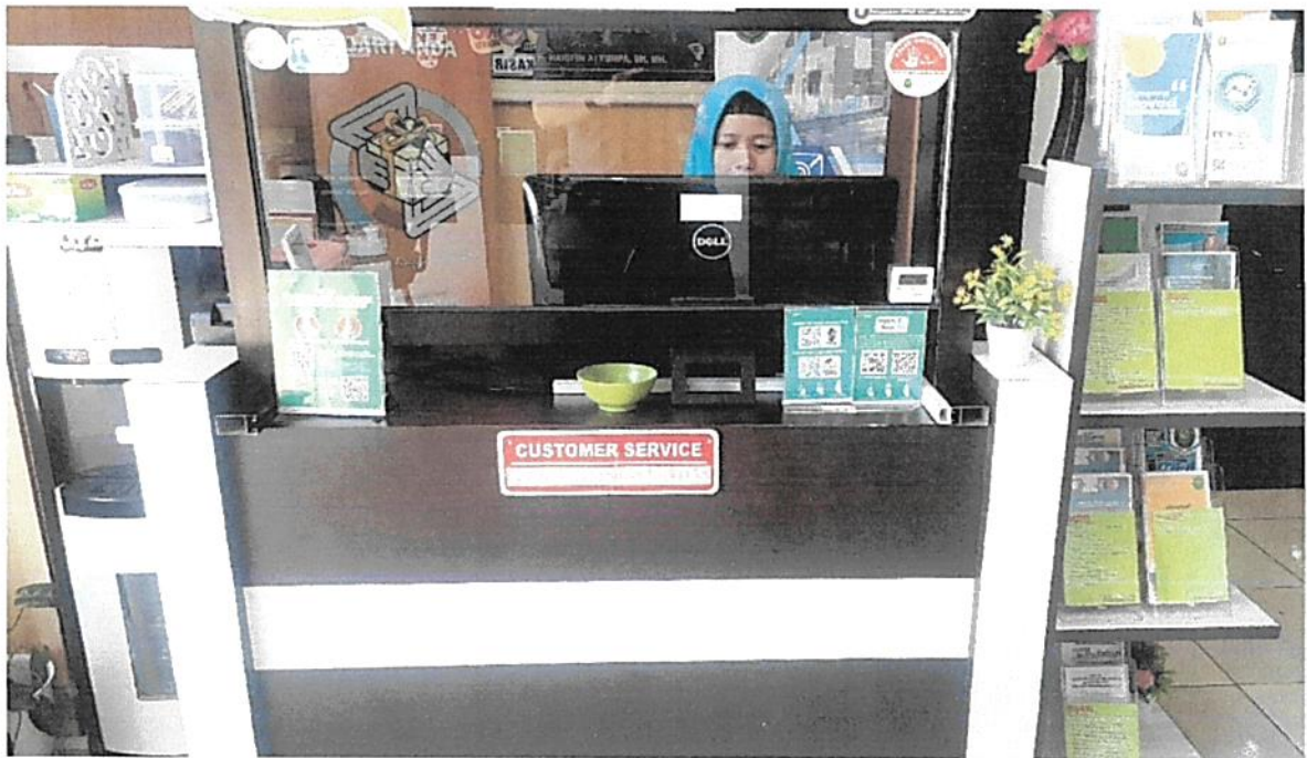
Meja Customer Service